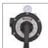
Vanne Vari-Flo™ 6 positions