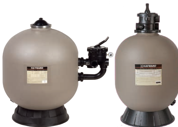
ProSeries™ HB Side