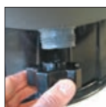
Drain avec son bouchon de grande dimension servant d'outil de démontage